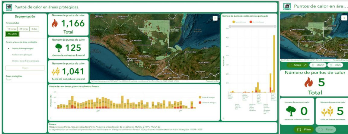
Figura 2. Tablero del Sistema Guatemalteco de Áreas Protegidas